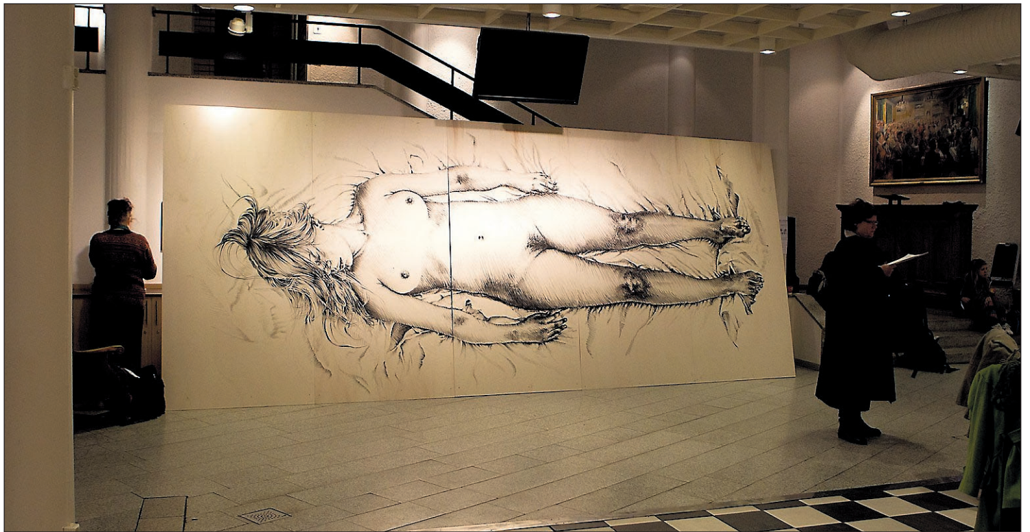
STYR: Dette seks meter lange bildet av ei naken kvinne vakte en del styr på globaliseringskonferansen i Folkets Hus i Oslo i slutten av forrige måned.