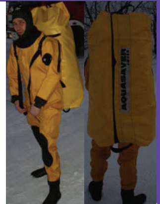
Lett å bære