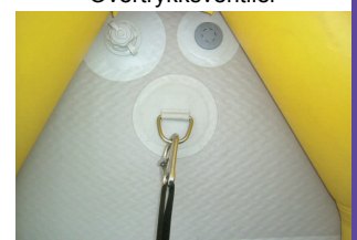
Feste for sikkerhetssele