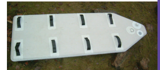
Avtagbar bunn (bære)