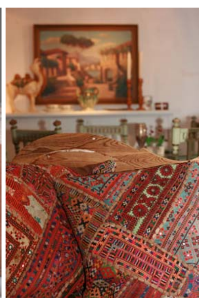
Inventar med sjel til hytta